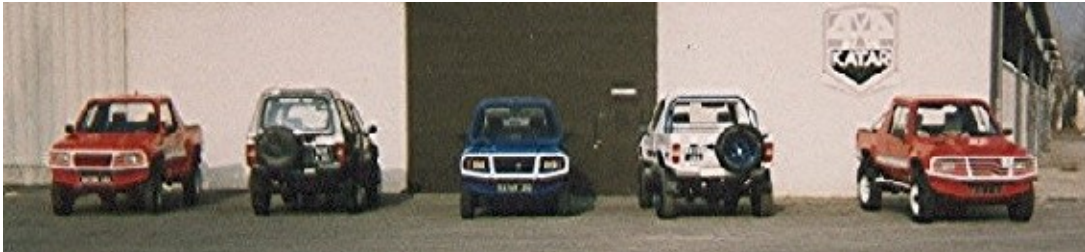
Homologation 1991 du Katar II Diesel