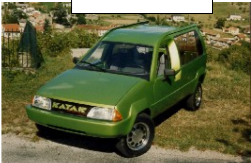
1988 Katar 2000