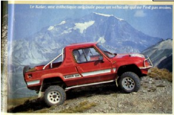
1990 création du Katar II