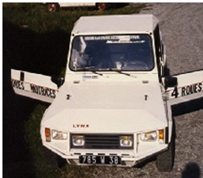
1985 Lynx II