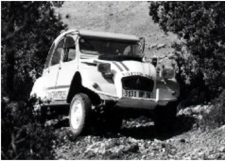
1983 – 84 2cv Voisin 4x4 Isère