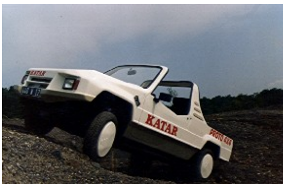
Prototype du 1 er Katar 4x4