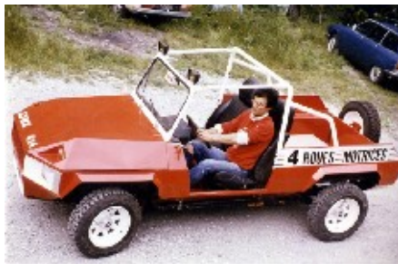
1984 Lynx I